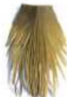
Srednja bočna strana 71 cm × 48 cm