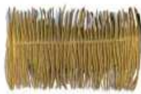
Srednje sljeme 100 cm × 74 cm