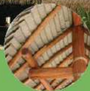
Proizvedeno u Kanadi

Za sve proizvode dostavljamo sljedeće komponente: