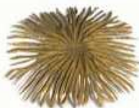
Gornji okrugli pokrov promjer 80 cm

Za sve proizvode dostavljamo sljedeće komponente: